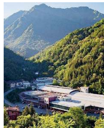
Lo stabilimento. A Brozzo di Marcheno